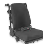
Rücken: ATC 2174, 2175