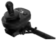
2231 / 2232