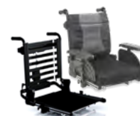
Rücken: ATC 2171