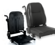
Rücken: ATC 2172 bzw. 2173