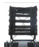
Rücken: ATC 2179